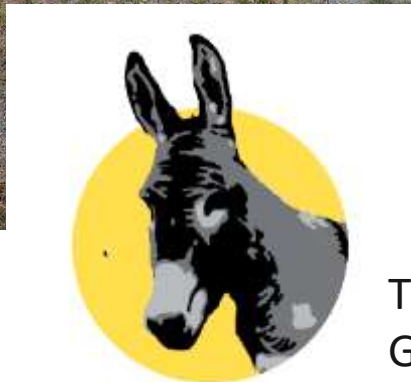
Themenweg Graacher Eselspädchen