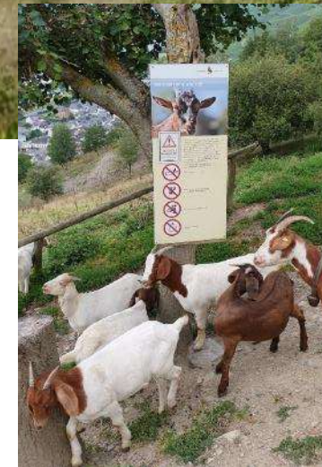
Hinweise zum Verhalten gegenüber Ziegen