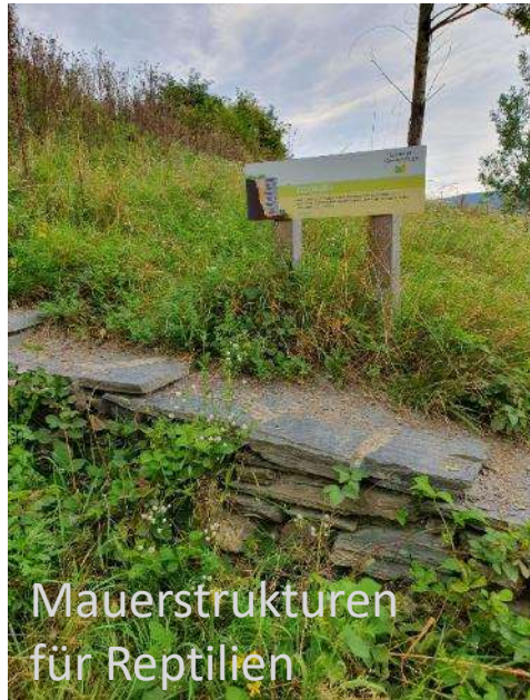
Mauerstrukturen für Reptilien