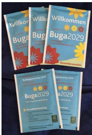
Samentütchen mit der Saattmischung ‚Bienenblumenwiese‘ im BUGA -Vereins-Design.