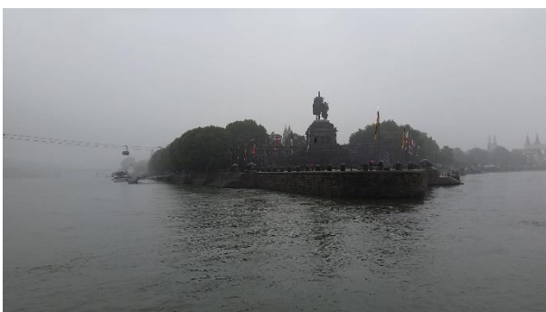
Stimmungsvolle Schifffahrt auf dem Rhein – Deutsches Eck